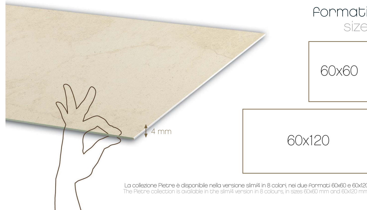
La collezione Pietre è disponibile nella versione slim/4 in 8 colori, nei due formati 60x60 e 60x120. The Pietre collection is available in the slim/4 version in 8 colours, in sizes 60x60 mm and 60x120 mm.

The production technology, which was developed within our plant, is completely different from the technologies utilised to manufacture products currently on the market. The tiles, in fact, are made by a pressing rather than a compaction process: this makes it possible to create a product that offers excellent resistance to the broadest possible range of stresses, that has no need for the incorporation of reinforcing fibre media, and that eliminates problems associated with material tensioning and stability after installation, while simultaneously facilitating cutting, drilling, and maintenance procedures.